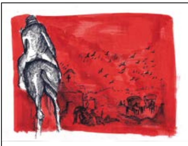
Ilustración: Melina Belloni

Colección "Nuestra América", volumen 2. Edición digital